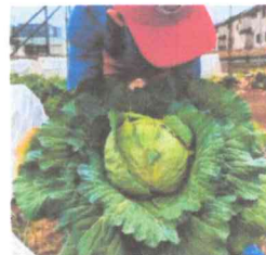
キャベツ・花芽収穫 (2024/03/24)