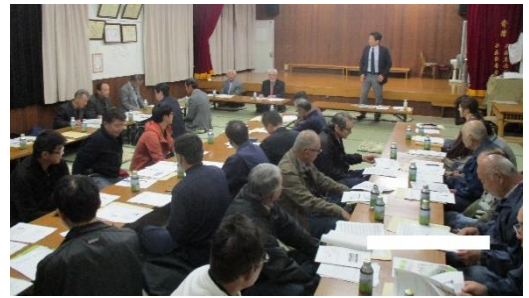
▲共益東部公会堂での懇談会