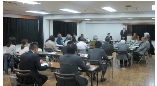
▲西町プラザでの懇談会