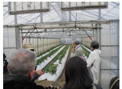
▲イチゴハウスの見学