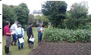
▲農地利用状況調査