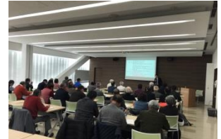
▲貸借円滑化法説明会