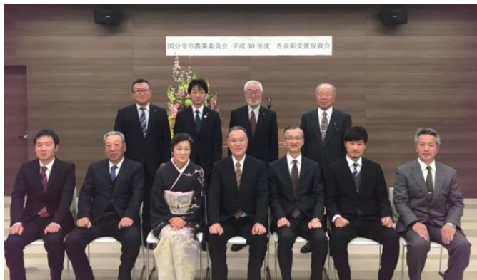
▲2月22日 受賞祝賀会の様子 JA東京むさし国分寺支店にて

市農業委員会等では、優秀な農業経営者や地域農業に功労のあった農業者に対して表彰を行っています。平成30年度の受賞者は次の方々です。また、平成31年2月22日に受賞祝賀会を開催しました。