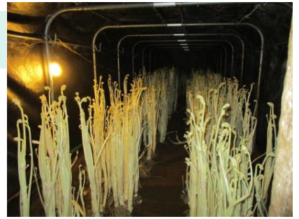
▲ハウスでのうど栽培

懇談会では、うどの歴史や栽培方法、おすすめの料理方法等、様々な質問がされ、市の特産品でもある「東京うど」について、参加者の皆様により知っていただくことができました。