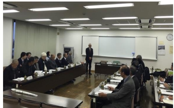
▲意見交換会の様子 (清瀬市の圃場を見学後、実施しました)

埼玉県との県境では、まだまだ広大な農地が残っており、野菜や植木等の畑が広がっています。当日は2件の圃場を見学させていただき、意見交換会では、特定生産緑地制度や後継者問題等、様々な意見が交わされ、とても有意義な視察となりました。清瀬市農業委員会の皆様、貴重なお時間をありがとうございました。