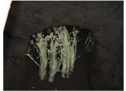
▲穴蔵でのうど栽培