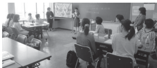
前回の学習会(恋ヶ窪)

申込み { 9月17日(火)午前9時から10月10日(木)までに電話または直接もとまち公民館へ(先着順)