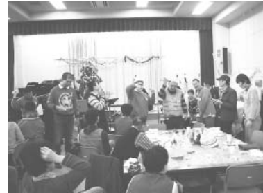
並木 クリスマス会

この教室はスタッフの年齢がさまざまで、教室参加者にとっては、スタッフの皆さんは近所のおじさん、おばさん、お兄さん、お姉さん、友人のような存在で、とっても和やかな雰囲気です。活動しています。