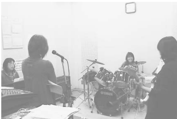
スタジオでの練習

スタジオは、防音設備があり、音楽の練習の場として活用されています。 録音室は講習を受講してから使用できます。