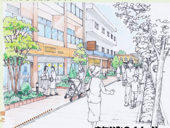
壁面後退により前面空間を創出して緑を配置した場合のイメージ

緑豊かな本エリアの特性を将来も維持するため、民有空間及び公共空間の 緑化を進めるとともに 、市の貴重な歴史資源である史跡との調和を図り、住みやすい住宅環境のまちを目指します。