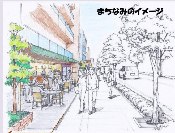
壁面後退によるオープンスペースを創出した場合のイメージ

中高層建築物の立地を誘導し、特に、駅に近い北側のエリアでは、 低層階に店舗等 があり学生や住民が集い楽しむことのできるまちを目指します。