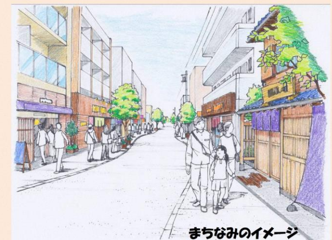
まちなみのイメージ

また、駅に近いエリアを中心に、建築物の 低層階に店舗等 が続き、人が集まり、人を呼ぶ、にぎわいのあるまちを目指します。