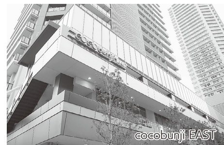
cocobunji EAST301区画ゾーニング(大まかな間取り)イメージ図