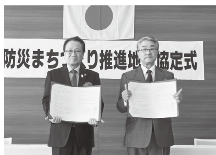
協定書を交換する市長と植田会長

都の創業関連補助金の概要や申請方法などをお伝えします。対創業を具体的に計画している方、創業後5年未満の方定20人