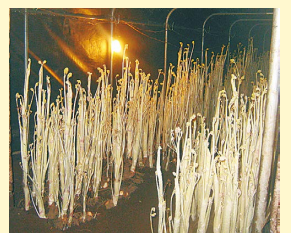
ハウスでうどを栽培

小学生以上の市内在住・在勤・在学・在活の方※小学生は保護者同伴 対 うど農家見学、地場産野菜(こくべじ)を使用した弁当とうど料理の昼食、農業者との懇談会※うどとうど料理レシピのお土産付き 定 30人 ¥1,000円(昼食代・保険料などを含む)※当日集金 申 3月4日(月)から電話で農業委員会事務局へ ※先着順 催 市農業委員会・市都市農政推進協議会・JA東京むさし国分寺地区 注 うどの室には入りません/自動車での来場不可(自転車は可)/歩いて移動するため、歩きやすい服装で参加