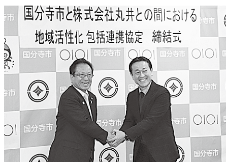
連携して取り組んでいきます

2月3日に、防災まちづくり推進地区第15号地区として、東恋ヶ窪4丁目自治会と協定を締結しました。同地区では、防災