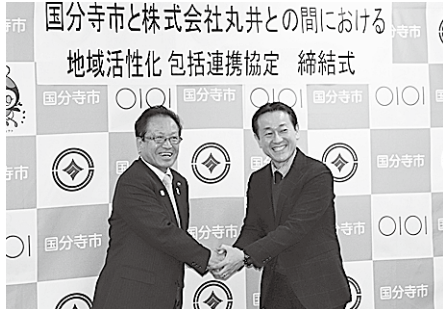
連携して取り組んでいきます