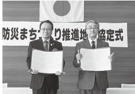
協定書を交換する市長と植田会長

2月3日に、防災まちづくり推進地区第15号地区として、東恋ヶ窪四丁目自治会と協定を締結しました。同地区では、防災