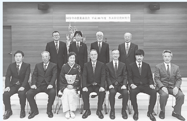
各表彰受賞祝賀会