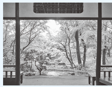
美しい新緑を味わいませんか