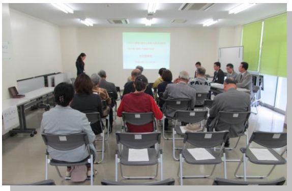
平成 30 年度ブロック塀助成制度に関する市民説明会(イメージ写真)