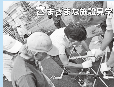
さまざまな施設見学