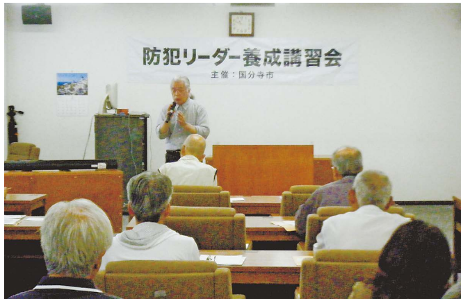
防犯への取り組み方や基礎知識を学べます

子どもから高齢者まで、安全で安心して暮らせる防犯まちづくりを実現するため、市民の皆さんや事業者などの自主防犯活動の活性化や犯罪の被害に遭わないために防犯への取り組み方、基礎知識を学ぶことを目的に開催します。