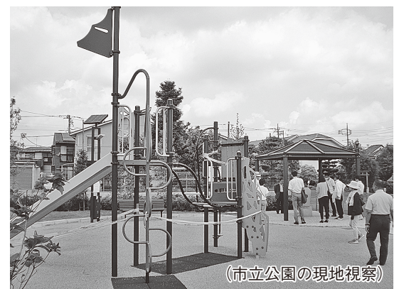
(市立公園の現地視察)