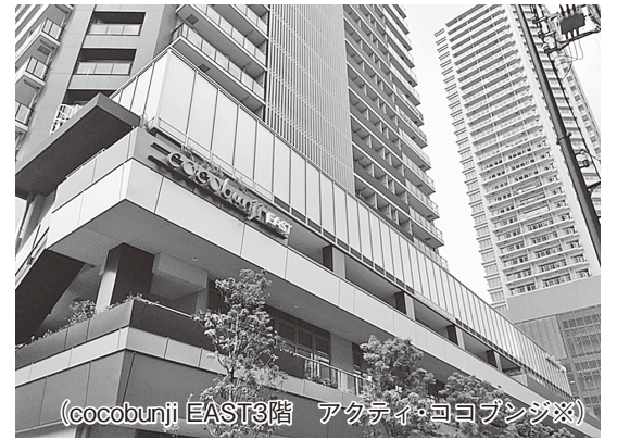
(cocobunji EAST3階 アクティ・ココブンジ※) ※市民活動センター等の機能を備えた新施設