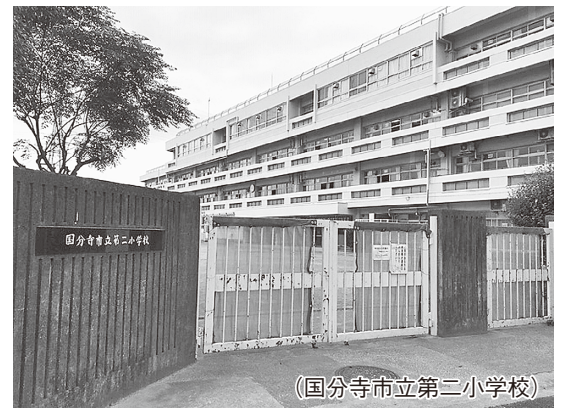
(国分寺市立第二小学校)