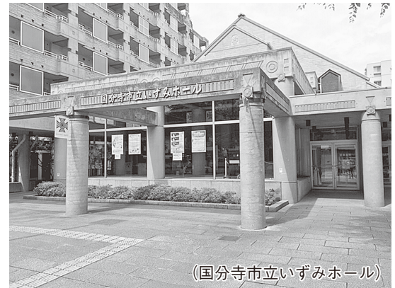
（国分寺市立いずみホール）

A 成績処理、子どもたちの出席管理等をシステム化する統合型校務支援システムである。教員の事務作業等が軽減され、事務の効率化が図れる。