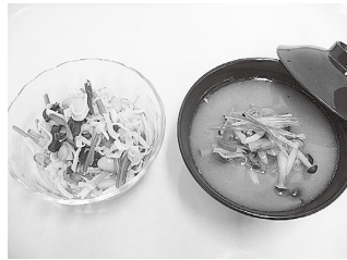
食生活のポイントを押さえた料理を試食しませんか(イメージ)

血中脂質の上昇や、動脈硬化の予防につながる食生活のポイントに関して、管理栄養士が楽しく分かりやすく話します。歯科衛生士のミニ講座や、簡単でおいしい野菜料理の試食もあります。