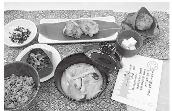
天平メニュー・国分寺ごはん