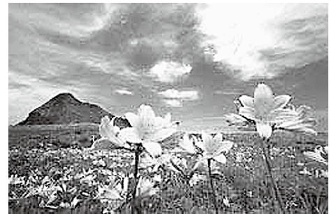
自然豊かな佐渡市を訪ねませんか

☎10人程度以上の団体で申請する場合は事前にご連絡ください/指定保養施設を利用した方が佐渡市で薪能を有料で鑑賞した場合、その料金の一部または全部を助成します。詳しくは直接人権平和課へお問い合わせください