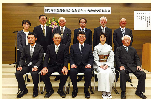
各表彰受賞の皆さんをお祝いしました