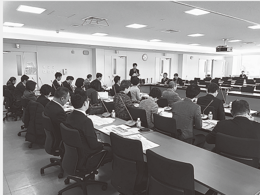
(青梅市新庁舎建設工事の概要説明の様子)