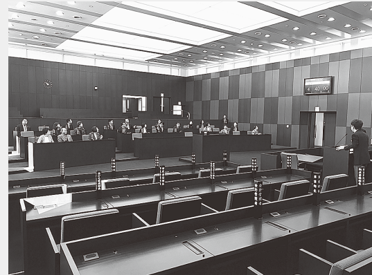
(青梅市議場視察の様子)

令和2年1月20日(月)に青梅市役所を訪問し、市庁舎と議会フロアについて視察しました。青梅市新庁舎建設工事の概要についてご説明いただき、利用しやすくするための工夫や市民サービスの向上のために配慮している点などを学びました。5年後の建設を目指している泉町への新庁舎建設の参考にしてまいります。