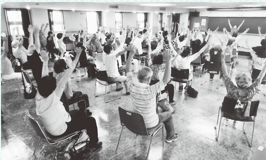
いきいき体操で健康に