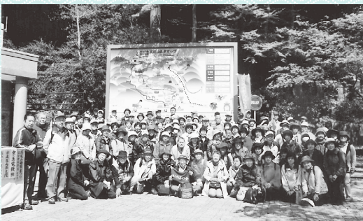
仲間と交流 歩こう会