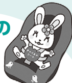
チャイルドシート着用推進シンボルマーク「カチャビヨン」