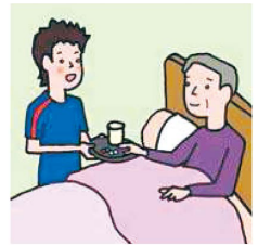
がん・難病・精神疾患など慢性的な病気の家族の看病をしている