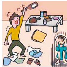
アルコール・薬物・ギャンブルなどの問題のある家族に対応している