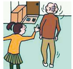
目を離せない家族の見守りや声かけなどの気づかいをしている