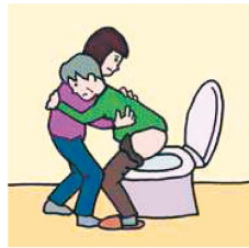
障がいや病気のある家族の入浴やトイレの介助をしている