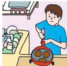
障がいや病気のある家族に代わり、買い物・料理・掃除・洗濯などの家事をしている

年齢や成長の度合いに見合わない重い責任や負担を負って、本来大人が担うような家族の介護や世話をすることで、自らの育ちや教育に影響を及ぼしている18歳未満の子どものことです。長期化すると介護と学業の両立だけでなく、生活することも困難になりかねません。