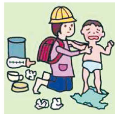
家族に代わり、幼い子どもの世話をしている