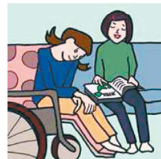
障がいや病気のあるきょうだいの世話や見守りをしている