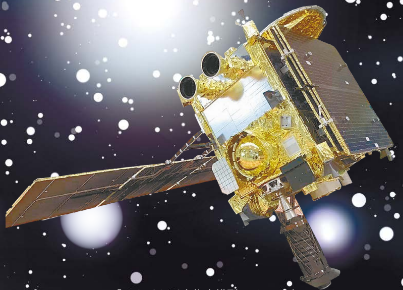
「はやぶさ2」実物大模型のイメージ