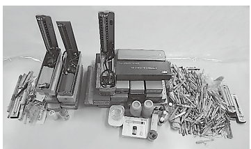
回収された水銀を含む製品

日野市・国分寺市・小金井市、浅川清流環境組合との共同で、令和2年10月15日～12月28日に下表のとおり水銀を含む製品を適正に回収することができました。