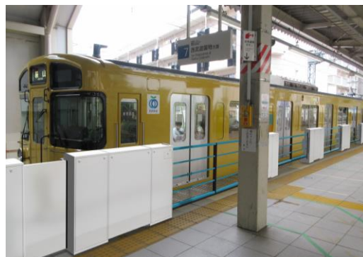
軽量型ホームドア設置イメージ (7番ホーム)