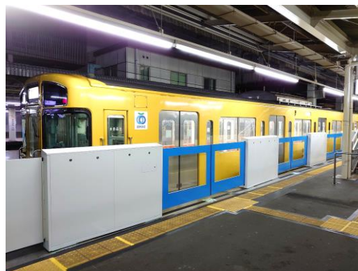
国分寺駅ホームドア設置の様子 (5番ホーム)