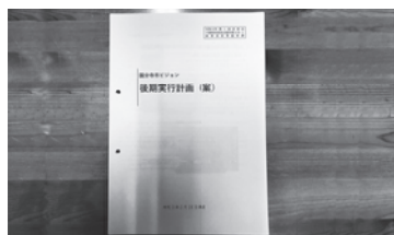
国分寺市ビジョン 後期実行計画(案)