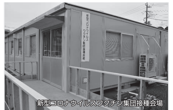
新型コロナウイルスワクチン集団接種会場

A 高齢者及び基礎疾患を有する方の範囲について、国のワクチン分科会の予防接種基本方針部会で協議を進めている。