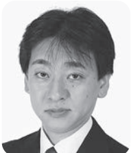
無党派 木村 いさお 徳

木村 平和事業に関し、市内児童が絵画の世界コンクールで受賞した。これは市長の平和施策の地道な取組が結実したものであるが如何か。 市長 平和の大切さを市として次世代に引き継ぐ事業をこれからも積極的に取り組んでいく。