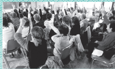
いきいき体操の様子（令和元年度）

入会希望の方＝直接下表の各クラブ会長へ 新たにクラブの設立を希望する方、老人クラブに関して＝高齢福祉課へ