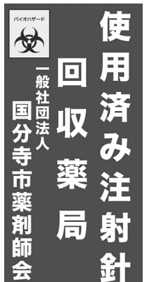
▲このステッカーが目印