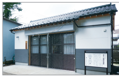
御神輿堂・説明板

見学日 毎週日曜日 午前10時～午後4時 事前電話 ☎(090)7726-1179へ