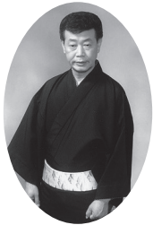
キューティーはしさん