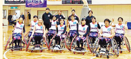
車いすバスケットボールチームGRACE