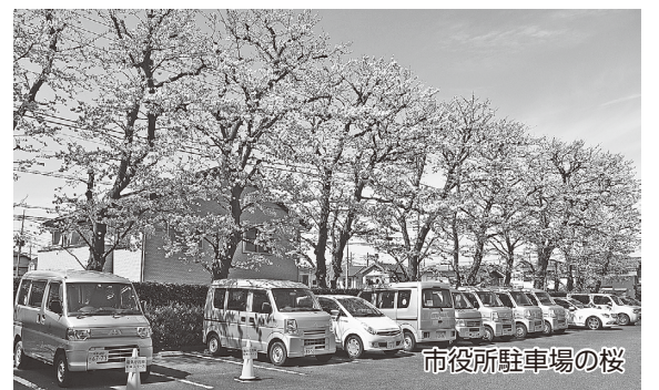
市役所駐車場の桜