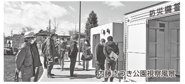
内藤さつき公園視察風景

・国分寺市バリアフリー基本構想（案）のパブリック・コメントの意見について ・ゼロカーボンシティとしての取組展開について など