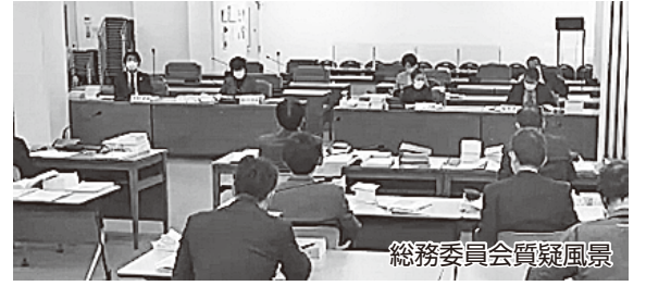
総務委員会質疑風景