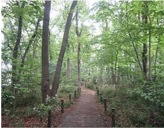
西恋ヶ窪緑地(通称:エクス山)