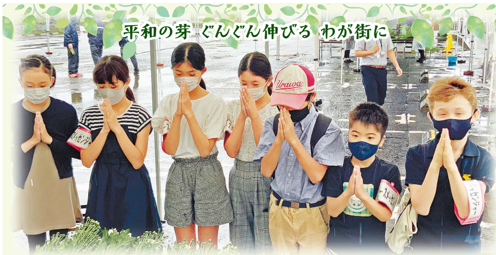
平和の芽 ぐんぐん伸びる わが街に

発行/国分寺市 編集/政策部市政戦略室 〒185-8501 東京都国分寺市戸倉1-6-1 ☎(042)325-0111 FAX(042)325-1380 市公式ホームページ(市HP)、市公式ツイッター、市公式フェイスブック、市モバイルサイトは、国分寺市 で検索 市長へのファクス☎(042)324-0906