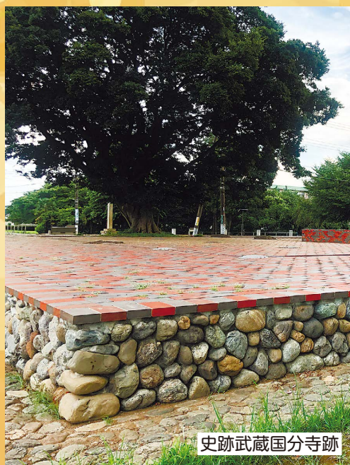
史跡武蔵国分寺跡