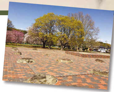
現在の僧寺金堂跡▲