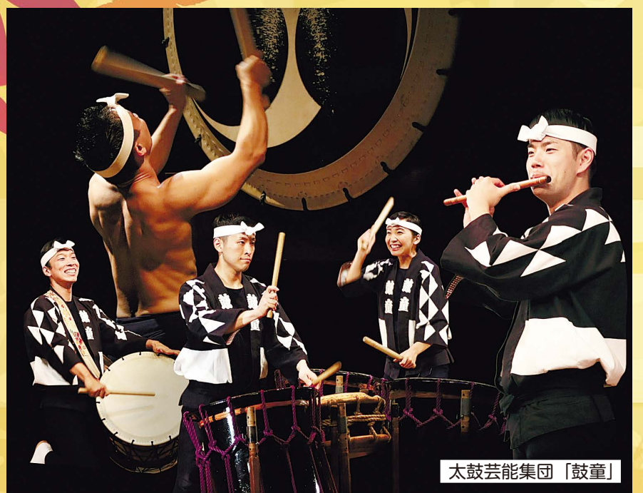
太鼓芸能集団「鼓童」

姉妹都市の新潟県佐渡市と友好都市の長野県飯山市・埼玉県鳩山町のことを知り、交流を深めませんか