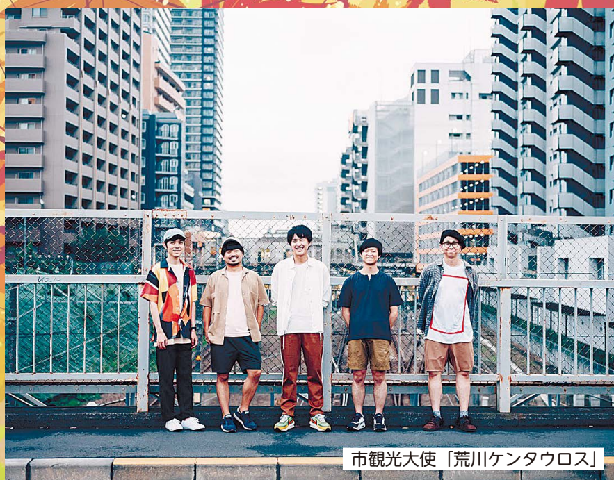
市観光大使「荒川ケンタウロス」