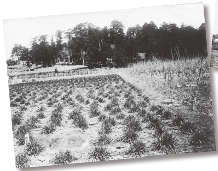
▲大正11年の僧寺金堂跡

武蔵国分寺跡は全国の国分寺と比べても規模が大きく歴史的重要性が認められたため、大正11(1922)年に国の史跡指定を受けました。平成22(2010)年度には、東山道武蔵路跡が追加で指定され、僧寺・尼寺・古代の官道が一体となった全国でも珍しい史跡です。記念講演会では武蔵国分寺跡のことや、関東周辺の国分寺のことを事例で紹介していきます。歴史・文化的価値を知り、郷土の宝である武蔵国分寺跡をみんなで未来につなげていきませんか。