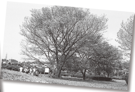
昭和63年の僧寺金堂跡▲