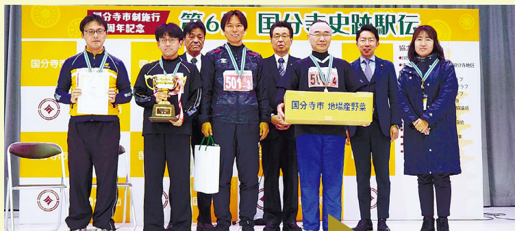
参加者全員に参加賞・記録証あり。入賞者にはメダルを贈呈