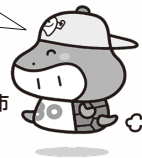
[カメ(噛め)ちゃん] 国分寺市 噛ミン30(サンマル)・食育推進キャラクター