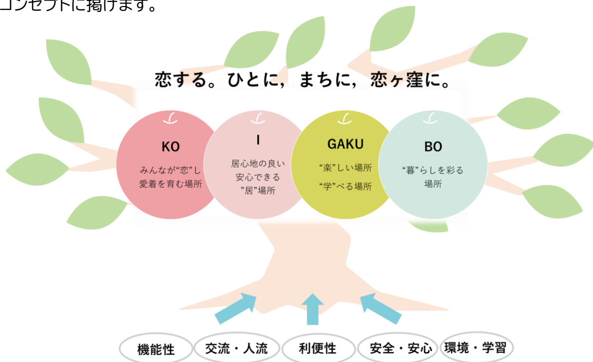
表:コンセプト策定における市民意見の反映結果