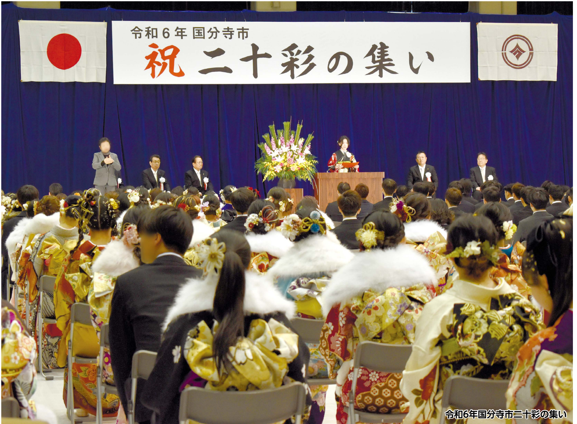
令和6年国分寺市二十彩の集い