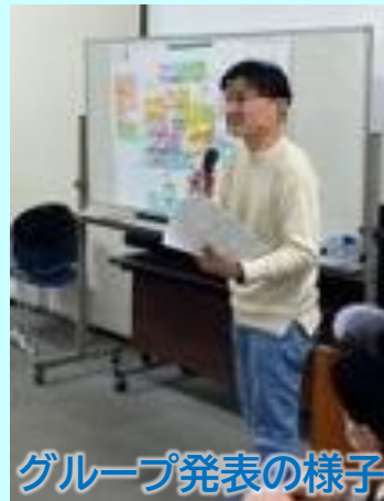
グループ発表の様子