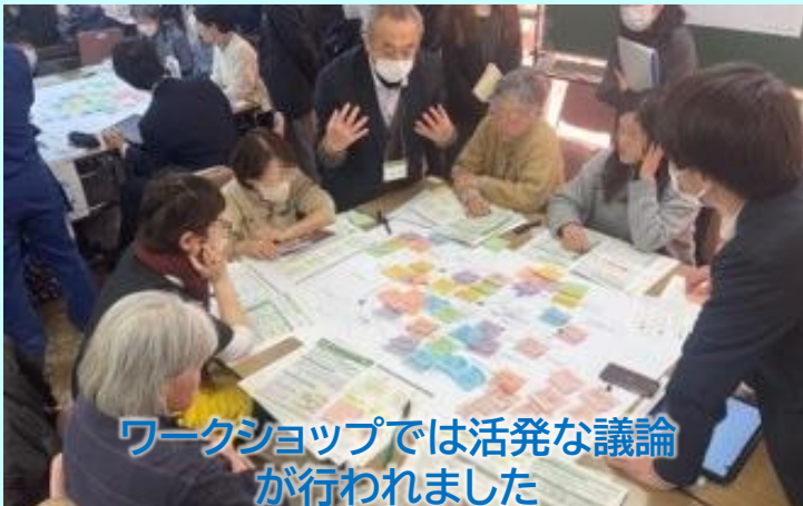
ワークショップでは活発な議論が行われました