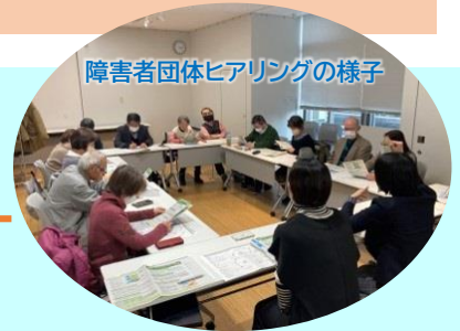
障害者団体ヒアリングの様子